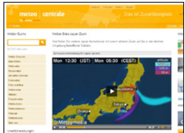
Meteoedia: Prognosen zur Emissionsverbreitung in drei verschiedenen Höhen

Wetterlage und Ausbreitungsbedingungen in Japan (zur Zeit auf der Homepage) http://www.dwd.def