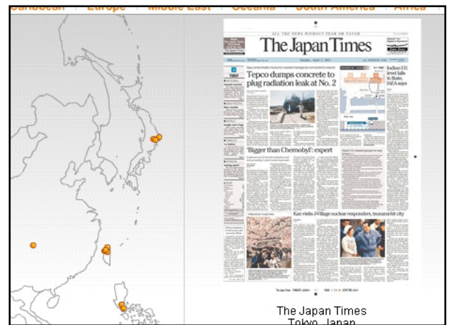
Täglich: Die Titelseiten japanischer Medien beim »Newseum«