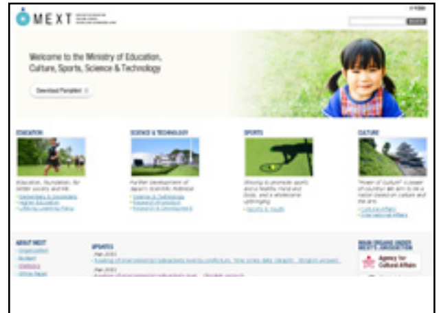
Japanischen Ministerium MEXT: Umfangreiche Lageberichte und Materialsammlung zu Fukushima