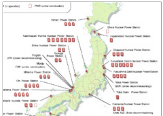
OECD-Basisinfos: Standort aller Kernkraftwerke in Japan

http://www.oecd-nea.org/press/2011/BWR-basics_Fukushima.pdf