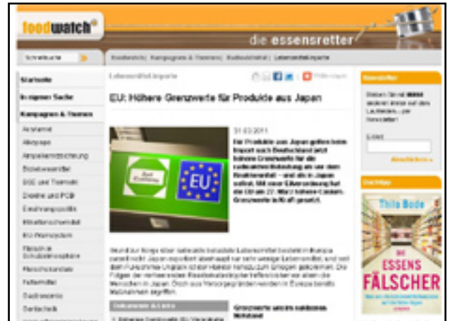
Foodwatch: Berichtet über höhere Grenzwerte bei japanischen Lebensmitteln

http://www.vzhh.de/ernaehrung/114907/Tabelle%201.pdf