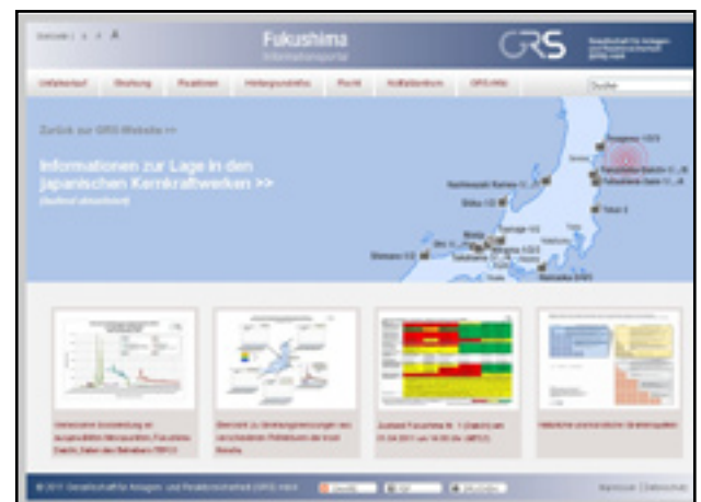
Fukushima Informationsportal: der Gesellschaft für Anlagen- und Reaktorsicherheit