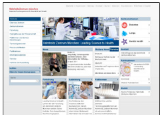
Helmholtz Zentrum München: Antworten auf Fragen zur biologische Wirkung von Strahlen

Schwerpunkt: Nukleare Sicherheitsforschung,