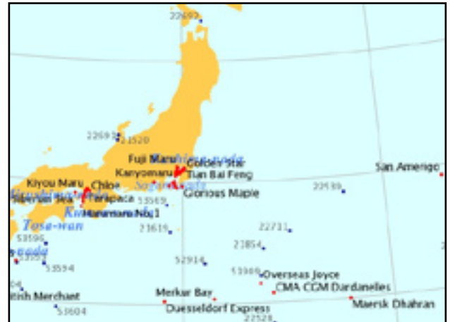
Shiptracker (Echtzeit): Schiffe vermeiden die Region um Fukushima

http://www.sailwx.info/shiptrack/shipposition.phtml?call=JGQH